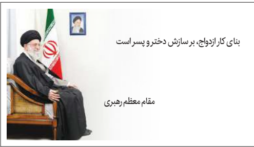
بنای کار ازدواج، بر سازش دختر و پسر است