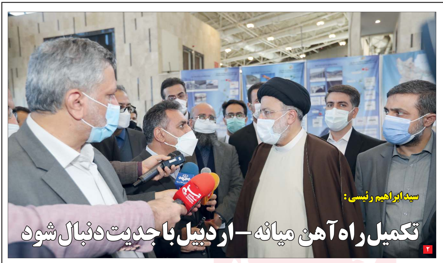
سید ابراهیم رئیسی: