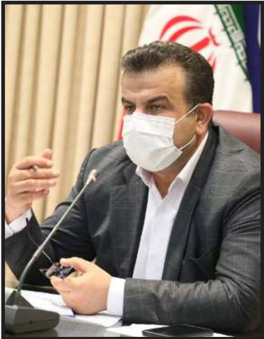
استاندار مازندران تنظیم بازار را مهم‌ترین دغدغه مدیریتی زمان حاضر دانست و تاکید کرد : فرمانداران شهرستان‌های استان نظارت‌ها

بر بازار عرضه و تقاضا در استان را با هدف جلوگیری از افزایش کاذب قیمت مایحتاج عمومی تشدید کنند. احمد حسین زادگان در نشست با فرمانداران استان افزود: اولویت اصلی نظام و دولت افزایش رضایتمندی جامعه است و فرمانداران علاوه بر تشدید نظارت بر بازار ، طرح‌های مرتبط با شهرستان‌ها را با جدیت پیگیری کنند تا به اتمام برسد. نماینده عالی دولت در مازندران رفع مشکلات واحدهای تولیدی و توجه به طرح‌های نیمه تمام را از دیگر محوره‌های کاری مهم فرمانداران برای افزایش میزان رضایتمندی جامعه دانست و گفت : جذب سرمایه گذار و مقابله با کرونا هم همچنان باید با جدیت در دستور کار فرمانداران باشد.حسین زادگان تصریح کرد: گردشگری یک ظرفیت توسعه‌ای و اقتصادی برای مازندران است و در این راستا بوم‌گردی بویژه استفاده