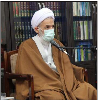
بستند، نا امید نشوند.

*برگزاری اربعین باشکوه برای علامه حسن زاده آملی