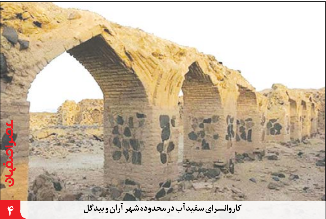
کاروانسرای سفیدآب در محدوده شهر آران و بیدگل

صدور سند برای ۱۱ هزار هکتار از اراضی کشاورزی گلپایگان