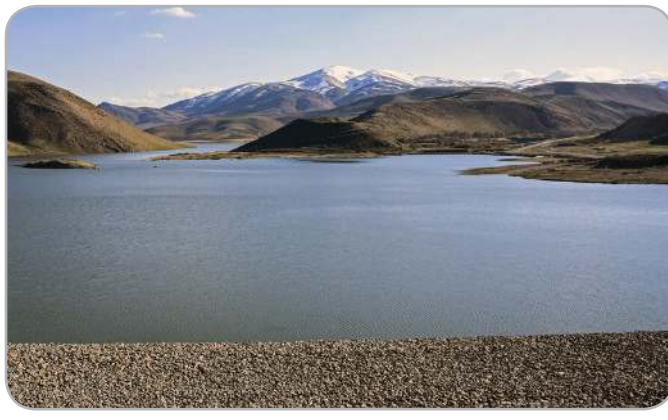
وی در باره آخرین وضعیت مخازن سدهای کشور از ابتدای سال آبی جاری تا ۲۸ فروردین ۱۴۰۳ ادامه داد: ورودی سدهای کشور در حال حاضر ۲۳۶۱ میلیارد مترمکعب