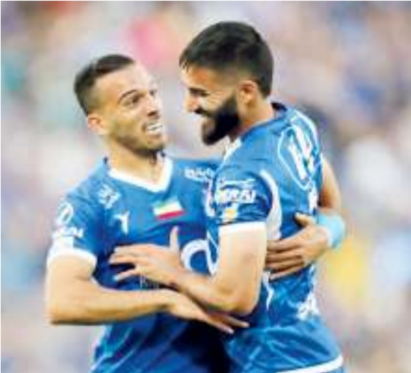
این هفته بود. دو گل شهریار به سپاهان کمک کرد تا بازی یک بر صفر عقب