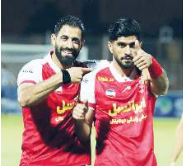
کسر. او فاصله زیادی با تکرار عنوان آقای گلی هم ندارد.