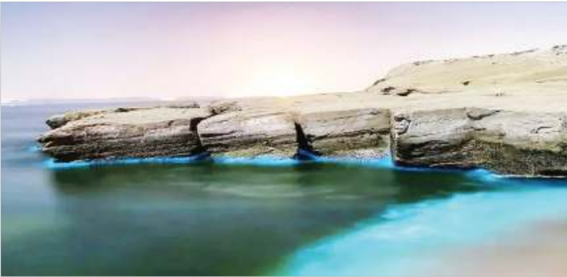
جزیره هنگام ششم