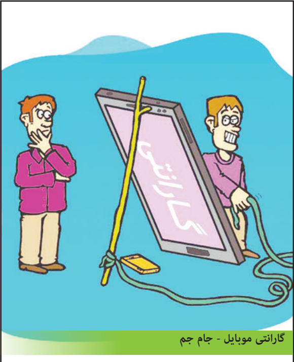
گزارتی موبایل - جام جم