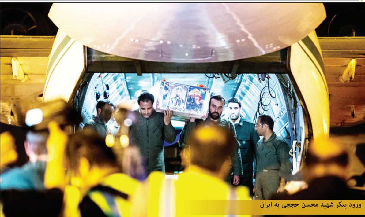
ورود پیگر شهید محسن حججی به ایران