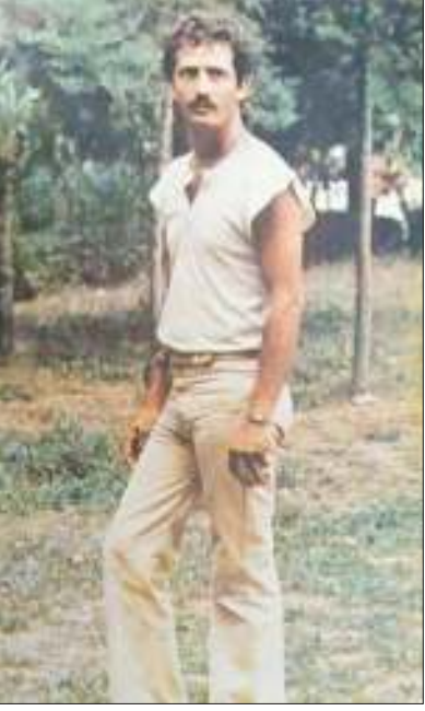
طراح: حمیدرضا محمدضایی