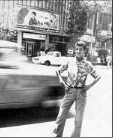
۱ قاب نوستالژی عکس یادگاری مقابل سینما حافظ با تبلیغ فیلم مهر مادر بر سر در آن در خیابان شاه‌آباد (جمهوری) سال ۱۳۵۰