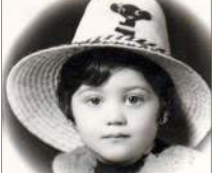
۴. شبنم مقدمی عکسی از سه سالگی خود را منتشر کرده