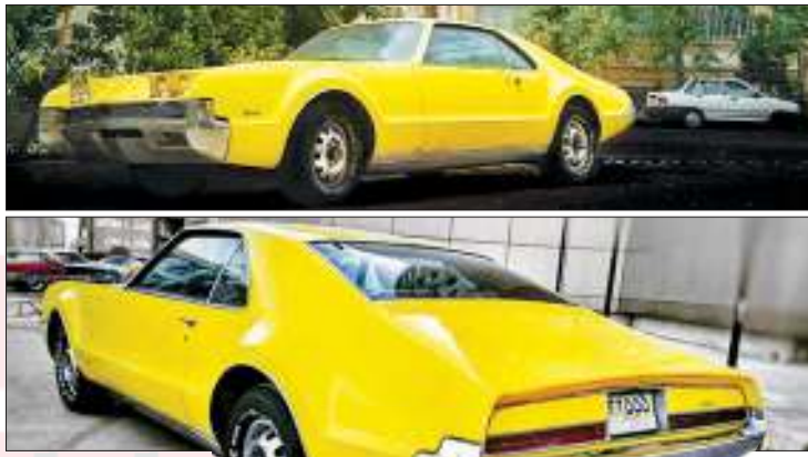
تورناردو؛ طوفان زردی که زود خاموش شد