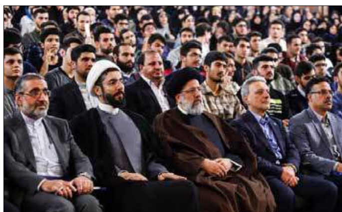
مراسم گرامیداشت روز دانشجو در دانشگاه تهران

عضو فراکسیون امید درباره سرلیست اصلاح طلبان در تهران در نبود عارف تصریح کرد: ثبت نام و سایر مراحل انتخابات باید انجام شود سرلیست پیدا کردن کار سختی نیست.