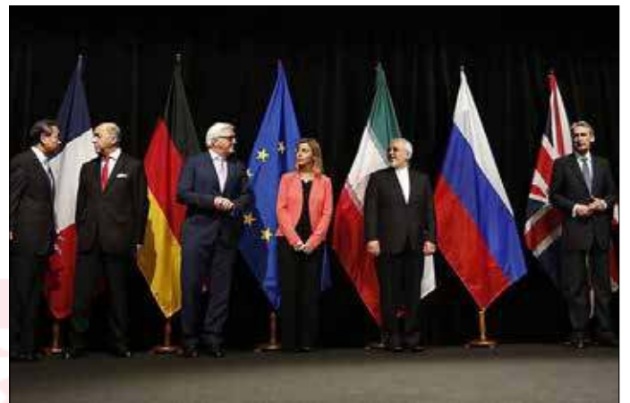
در پی قطع همکاری در پروژه تولید ایزوتوپ‌های پایدار

سرگئی ریابکوف، معاون وزیر خارجه و مذاکره‌کننده ارشد هسته‌های روسیه پس از اعلام گام چهارم ایران و آغاز گازدهی به سانتریفیوژها در فردو، گام جدید ایران برای کاهش تعهدات هسته‌ای را منطقی دانست و گفت: ما گام جدید طرف ایرانی برای کاهش تعهدات داوطلبانه این کشور را پیامد منطقی رکود در حل مسائل معلوم در رابطه با پایداری برجام و تأمین نتایج اقتصادی اجرای این معامله می‌دانیم که ایران امیدوار به آن بود.