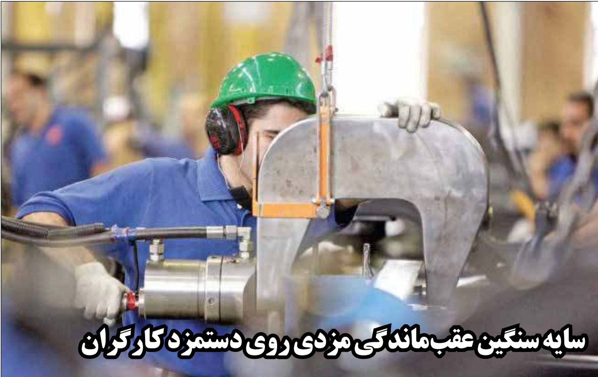
سایه سنگین عقب ماندگی مزدی روی دستمزد کارگران