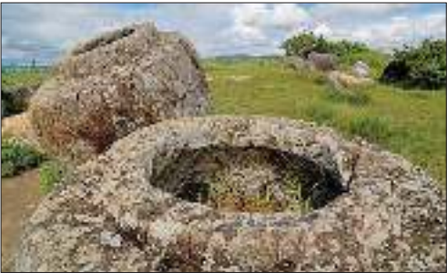
دشت کوزه ها در لائوس