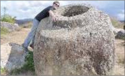
دشت کوزه ها در لائوس