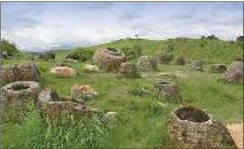
دشت کوزه ها در لائوس

در کشور لائوس دشتی وجود دارد که از کوزه های سنگی عجیبی پوشیده شده است. خمره‌ها عمدتاً در خوشه‌های مختلف در تعداد از یک تا چند صد مورد مرتب شده‌اند. در میان تپه ها و ارتفاعات بخش های شمالی لائوس به دشتی عجیب برمی خوریم که سال ها کوزه های اسرار آمیز و سنگی اش همه باستان شناسان را به فکر فرو برده که چه رازی پشت ساخت آن ها وجود دارد. در این دشت تعداد بسیار زیادی کوزه سنگی وجود دارد که با قدمت طولانی خود سائیتی باستانی را شکل داده اند. دشت کوزه ها همه المان های لازم برای به هیجان در آوردن قوه تخیل را دارد، دشتی که مملوء از رمز و رازهای سربه مهر است و تحقیقات زیادی روی آن انجام شده است.