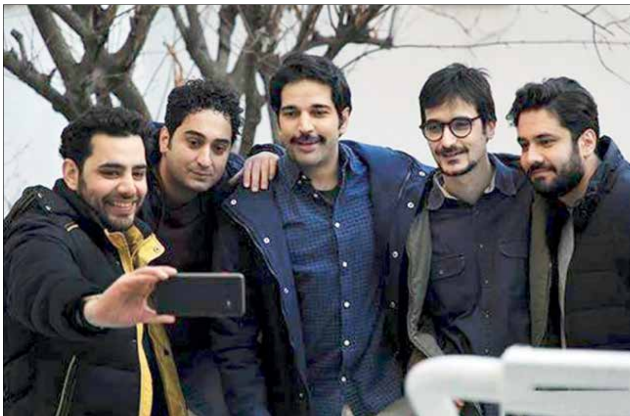
با این جمع فصل جدید روزگار جوانی پخش می‌شود

گروه باید به صورت فشرده کار را به پایان برساند و همین است که دیگر نمی‌توان مصاحبه دیگری انجام داد و صحبت‌های تهیه‌کننده خاتمه گزارش می‌شود.