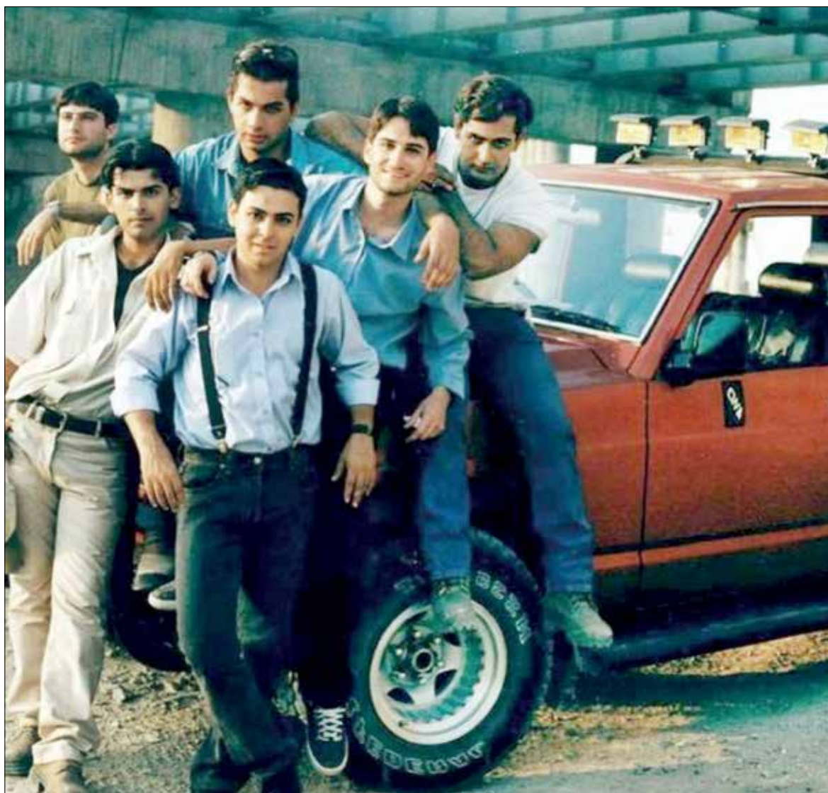
سریال خط قرمز در دوره خودش خلق عادت های زیادی داشت