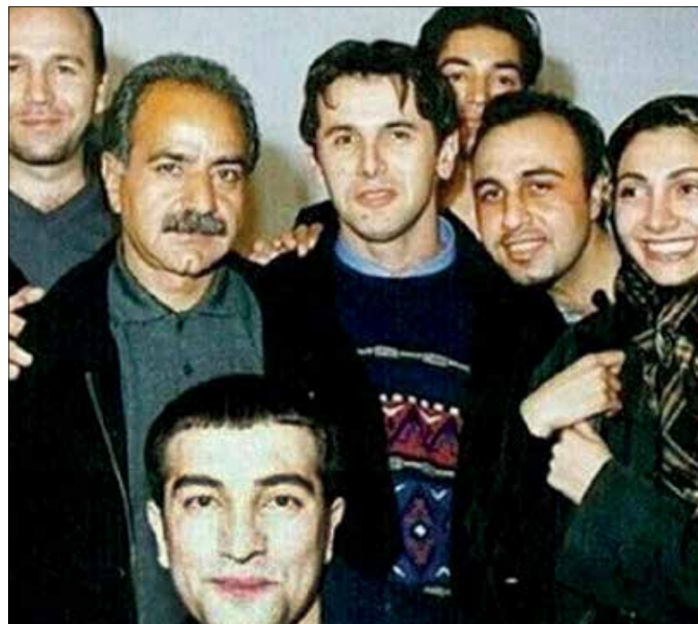
پرویز پرستویی و چند بازیگر دیگر به عنوان بازیگر مهمان در روزگار جوانی

عمومی بین اغلب جوان ها است و باید جدی گرفته شود. خدمت وظیفه عمومی گرچه به طور مستقیم فقط پسرهای جوان را درگیر می کند اما از آنجا که بسیاری شان ازدواج کرده یا در آستانه ازدواج قرار دارند، عملاً روی شرایط بسیاری از دخترها هم تأثیرگذار است.