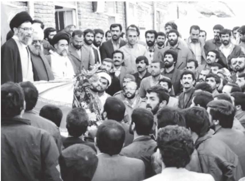
به مناسبت دهمین سالگرد آیت‌الله مسلم ملکوتی رحمته‌الله