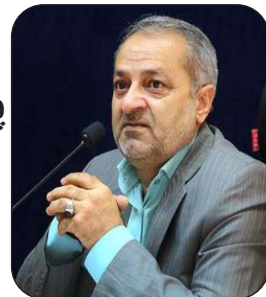
وزیر پیشنهادی پزشکیان برای آموزش و پرورش را بیشتر بشناسید