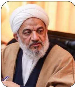
آقای تهران رئیس کمیسیون فرهنگی مجلس شد