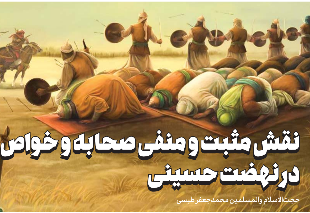
تپیه الخواطر و نزهة النواظر، ج ۱، ص ۴۸

حادثه بی نظیر عاشورا واقعاً صحنه آزمایش برای همه طبقات بود و از جهت دیگر همه اقشار مردم در برابر قیام سیدالشهدا علیه السلام مسئول بودند که آن‌حضرت را یاری و نصرت ببخشند. حال عده‌ای از زیر بار این مسئولیت سنگین شانه خالی کردند و عده‌ای عاقبت‌طلب به ندای «هل من ناصر ینصرنی» حضرت، پاسخ منفی دادند و از کنار صحنه گذشتند و نامشان در لیست تبهکاران ثبت گردید. از میان این عده، صحابه و خواص، مسئولیت‌شان مضاعف