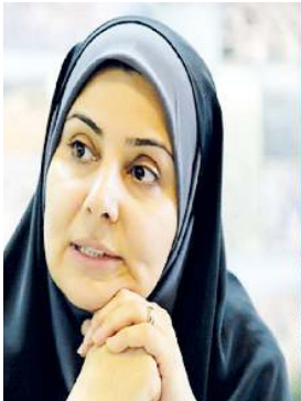
به ساخت سرپنجاه برای مردم که می‌شود، بانک‌ها منابع ندارند!

این در حالی است که اگر نگاهی به وام‌های کلان بانک‌ها به شرکت‌های زیرمجموعه یا همان حیاط خلوت بانک‌ها داشته باشیم، بانک‌ها در پرداخت وام کلان به خودی‌ها، از هیچ فرصتی دریغ نمی‌کنند، حتی هوای کارمندانیشان را هم دارند تا از وام‌های کم‌بهره بی‌نصیب نشوند، اما نوبت