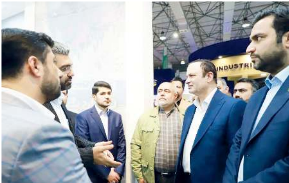
کیش است با حضور در غرفه سازمان منطقه

در ادامه روند این بازدید، معاون سرمایه گذاری و توسعه کسب و کارها سازمان منطقه آزاد اروند با اعلام ۱۲۶ بسته طراحی شده و مجوزات بی نام انجام گرفته، گزارش جامعی از عملکرد این معاونت به دبیر شورای عالی مناطق آزاد و ویژه اقتصادی، ارائه داد.