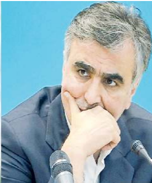
بسا عرضه قطره چکانی خانه به بازار مواجه می‌کند.

این صحبت فرزین، در واقع تیر خلاصی بر انتظارات مردم برای ابلاغ وام ۸۰۰ میلیونی ساخت مسکن به بانک‌های عامل بود. موضوعی که با توجه به کاهش ارزش وام ۵۵۰ میلیون تومانی و افزایش هزینه‌های ساخت و ساز، خبر خوبی برای توسعه و سرعت بخشیدن به ساخت و ساز در کشور نیست و بازار مسکن را بیش