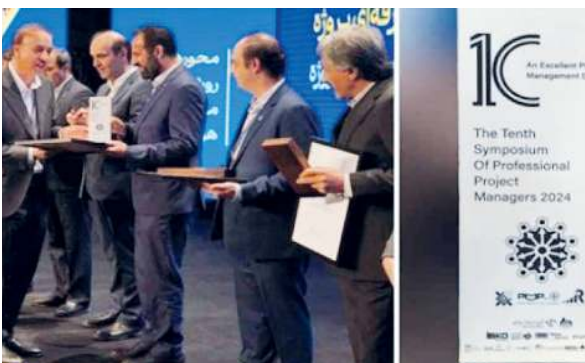
استانداردهای بالای صنعت به ویژه در حوزه پتروشیمی، شایسته تقدیر شناخته شد.