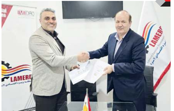
اینوکس در مرکز همایش‌های بین المللی کیش، تفاهم‌نامه مشترک جهت یازدهمین دوره رویداد اقتصادی کیش