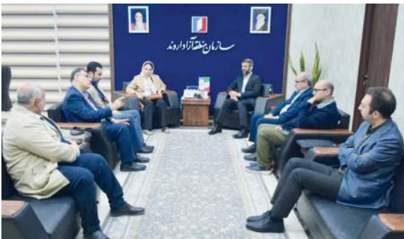
معاون دانشگاه علوم پزشکی آبادان حضور داشتند.