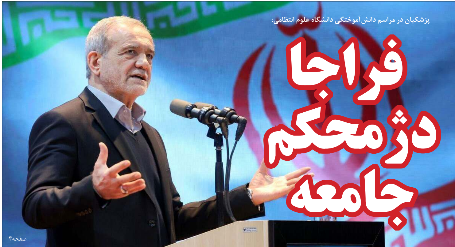
یزشکبان در مراسم دانش آموختگی دانشگاه علوم انتظامی: