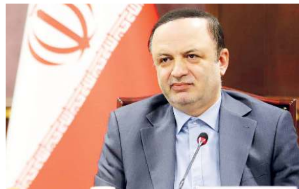
سرویس خبر - پیگیری های ویژه «رضا مسرور» دبیر شورایی مناطق آزاد و طی ابلاغیه دبیر هیئت دولت، دبیرخانه شورای عالی مناطق آزاد و ویژه اقتصادی

مرجع هماهنگی دستگاه های اجرایی در مناطق آزاد کشور شد. طی ابلاغیه دبیر هیئت دولت، دبیرخانه شورای عالی مناطق آزاد و ویژه اقتصادی مرجع هماهنگی دستگاه های اجرایی در مناطق آزاد شد. در این ابلاغیه آمده است: طبق بند «الف» ماده (۶۵) قانون احکام دائمی برنامه های توسعه کشور مصوب ۱۳۹۵، مدیران سازمان های مناطق آزاد به نمایندگی از طرف دولت، بالاترین مقام منطقه محسوب می شوند و کلیه وظایف، اختیارات و مسئولیت های دستگاه های اجرایی دولتی مستقر در این مناطق به استثنای نهادهای دفاعی و امنیتی به عهده آن ها است. در ادامه نامه آمده است همچنین به موجب تصویب نامه شماره ۱۶۰۶۵۱/ت/۹۵۹۹۹ هـ