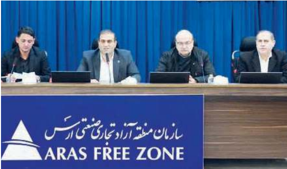
و گفت: بازاریان و فعالان اقتصادی ارس نه تنها پشتوانه سازمان بلکه نیروی محرکه و سرمایه اجتماعی ارزشمند منطقه می‌باشند و پویایی اقتصادی ارس با همکاری و حمایت فعالین اقتصادی محقق خواهد شد.

ساختاری، در چارچوب قانون مرتفع شود. پیگیری هـا برای افزایش ۱۵۰ قلم کالای جدید به لیست کالای همراه مسافر و فعال سازی «کارت ارس و ندی» در حال انجام و در دستور کار قرار گرفته‌اند. همچنین در خصوص بحث مالیات بر ارزش افزوده با توجه به اینکه منطقه آزاد ارس تنها منطقه آزادی است که هر سه مولفه تراز مثبت، مصور بودن و عدم وجود ثقل جمعیتی شامل آن می‌شود، با تشکیل کمیته‌ای به‌جد پیگیر لغو آن خواهیم بود و تلاش می‌کنیم وضعیت اقتصادی منطقه را بیش از پیش تسهیل کنیم. فرآیند نظارت بر استانداردها