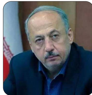
معاون عمرانی و امور شهری وزارت کشور از تمدید زمان فعالیت شهرداران

همزمان با تمدید ۱۰ و نیم ماهه فعالیت شوراهای شهر خبر داد و گفت: با تمدید مدت فعالیت شورا، عمر مدیریت شهرداری نیز به‌طور طبیعی تمدید شده و کارها طبق روال ادامه پیدا خواهد کرد.