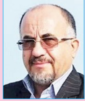
سادات «همروه» اسوه مکتب خلاق (۱)