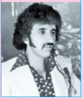
من باب راس نیستیم؛ بازیگر نقش استاد کمندی هستیم