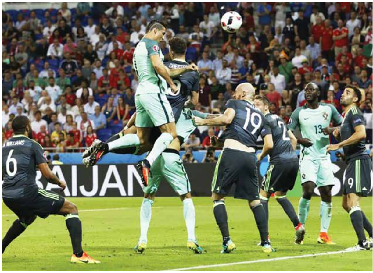
با دو گل نانی و رونالدو ظرف تنها ۳ دقیقه، پرتغال به فینال رسید و شگفتی سازی های ولز تمام شد. رونالدو برای زدن ضربه سر منجر به گلش، ۲۸۸ سانتیمتر به هوا پرید در حالیکه قد مدافع شماره ۱۹ ولز تنها ۱۸۸ سانتیمتر بود. بهترین بازیکن زمین: کریستیانو رونالدو (پرتغال)