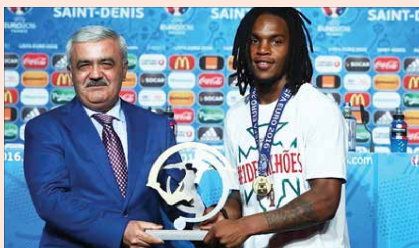
رنا تو سانچز جایزه بهترین بازیکن جوان یورو ۲۰۱۶ را کسب کرد. او با ۱۸ سال و ۲۲۸ روز سن، جوان ترین قهرمان تاریخ یورو هم شد.

بعد از ۵۱ بازی، یورو ۲۰۱۶ که از ۲۱ خرداد استارت خورده بود در ۲۱ تیر با قهرمانی پرتغال به پایان رسید.