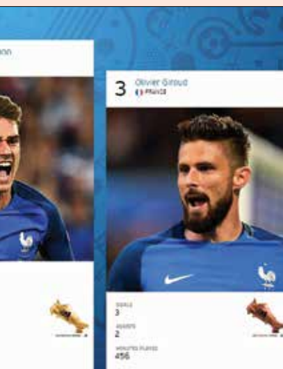
کفش طلای یورو به گریژمان رسید که ۶ گل زد و ۳ پاس گل تصاحب کرد و اولیویه ژیرو هم با ۳