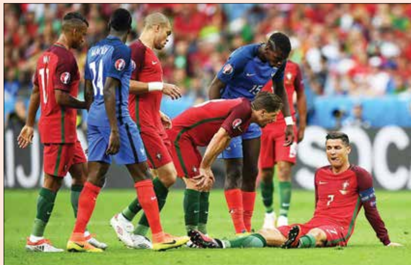
هنوز بازی به دقیقه ۲۵ نرسیده، رونالدو مصدوم شد و روی زمین نشست. ستاره اشک ریخت و از بازی بیرون رفت و تعویض شد.