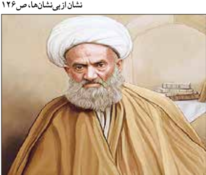
نشان از بی‌نشان‌ها، ص ۱۲۶

مرحوم نخودکی اصفهانی(ره): اول: انسان باید خود جد و جهد کند تا اطمینان نماید که طریقی را که می‌خواهد سلوک کند، طریق حق است. آنگاه که حقیقت طریق معلوم شد، اگر چند روزی فتح یاب نشد، سالک نباید دل‌تنگ شود. نه آنکه انسان از اول بدون آگاهی وارد طریق شود و در آخر همچنان مشکوک باشد که آیا این طریق حق است؟ و یا این راهنما راستگوست یا دروغگو و به خود بسته است؟ دوم: آنکه اگر انسان به وظایف خود عمل کند، خداوند مطالب را در هروقت و هر جا که باشد، به او می‌رساند.